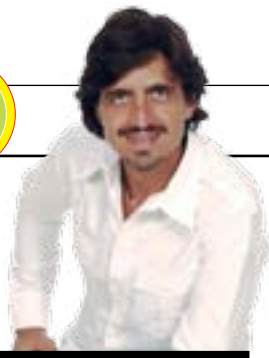
di Valerio Staffelli informatore pubblico